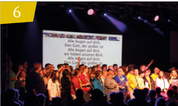
Religionspädagogik des CJD Mit Gott zu Sinn und Glück