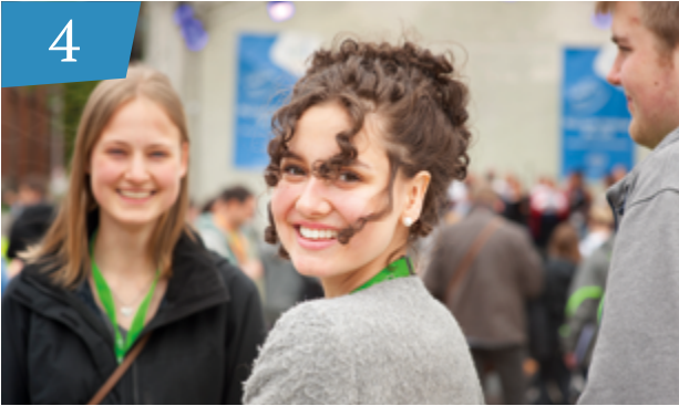
Die Persönlichkeitsbildung des CJD Der Innenbezug des Menschen