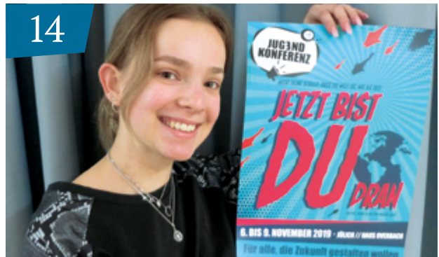
Politische Bildung des CJD Mitbestimmer*in statt Außenstehende