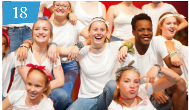
Die Persönlichkeitsbildung des CJD Alle gewinnen, wenn keiner verloren geht