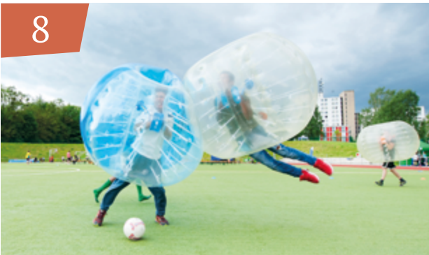
Sport- und Gesundheitspädagogik des CJD 1:0 fürs Ich – Weltmeister des Alltags