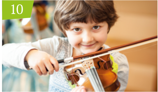
Musische Bildung des CJD Jeder Mensch ist ein Künstler